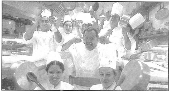
Èl Natal cristian e consumista: bon aptit!